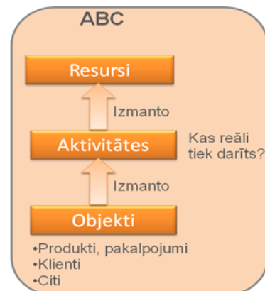
KĀ RODAS IZMAKSAS? KURI PROCESI IZMAKSĀ VISDĀRGĀK? KURI KLIENTI IZMAKSĀ VISDĀRGĀK? KURUS PROCESUS OPTIMIZĒT? KURUS PRODUKTUS NERAŽOT?